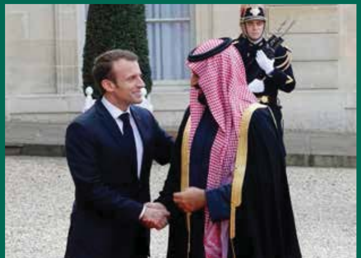
Visite officielle de Mohamed ben Salman à Paris en avril 2018