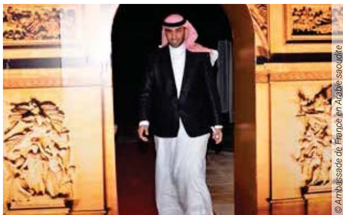
© Ambassade de France en Arabie saoudite

– 2 550 universités recommandées, par pays et par filières. Sur les 47 pays représentés, la France figure au 8 e rang avec 93 établissements, derrière les États-Unis (1 165), le Japon (254), l'Allemagne (172), la Chine (125), la Corée du Sud (118), le Canada (105) et le Royaume-Uni (104) ;