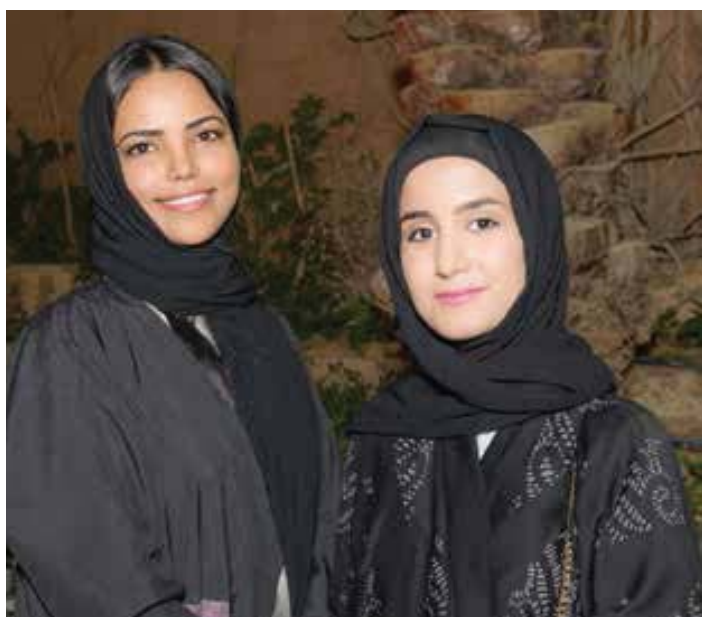
Lancement France Alumni à Riyad en 2017